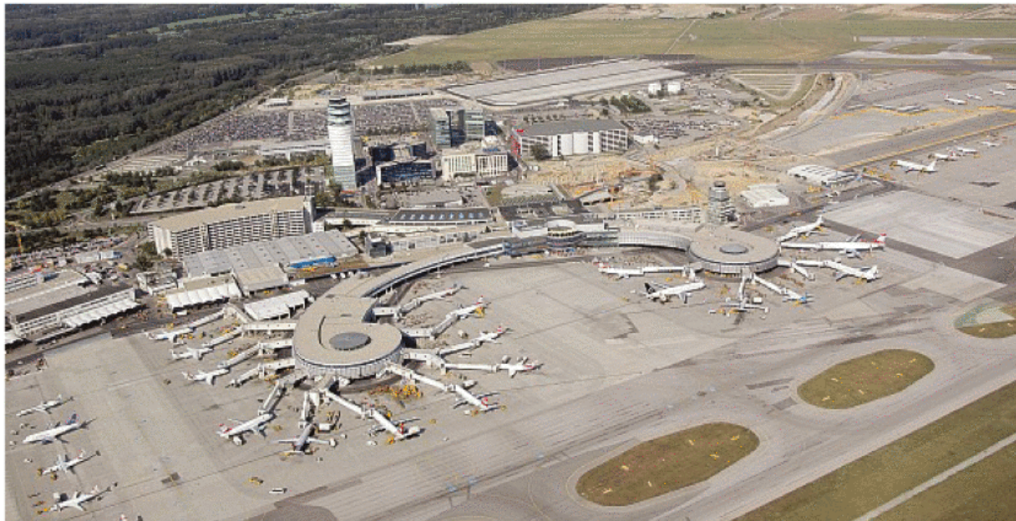
Der Ausbau des Flughafens Wien-Schwechat beschäftigt Tausende Flugrouten-Anrainer in Wien und NÖ. 14 Bürgerinitiativen beantragen im UVP-Verfahren Parteienstellung

Die Einspruchsfrist gegen das Großprojekt ist abgelaufen. 14 Bürgerinitiativen gaben ihre Stellungnahmen ab.